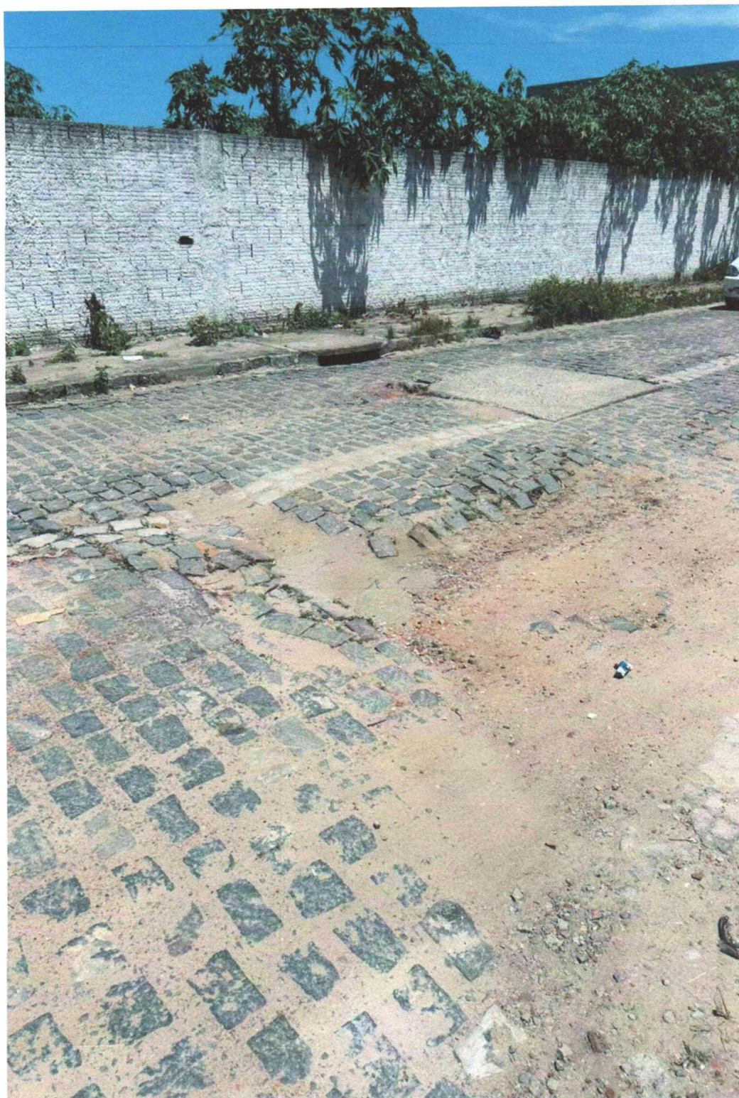
Anexo à indicação nº/2026. Registro fotográfico da demanda requerida realizado no dia 26/02/2026.