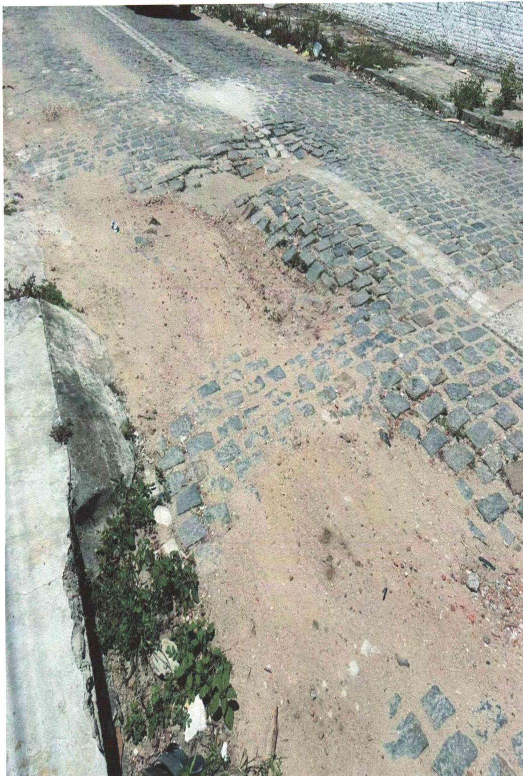
Anexo à indicação nº/2026. Registro fotográfico da demanda requerida realizado no dia 26/02/2026.