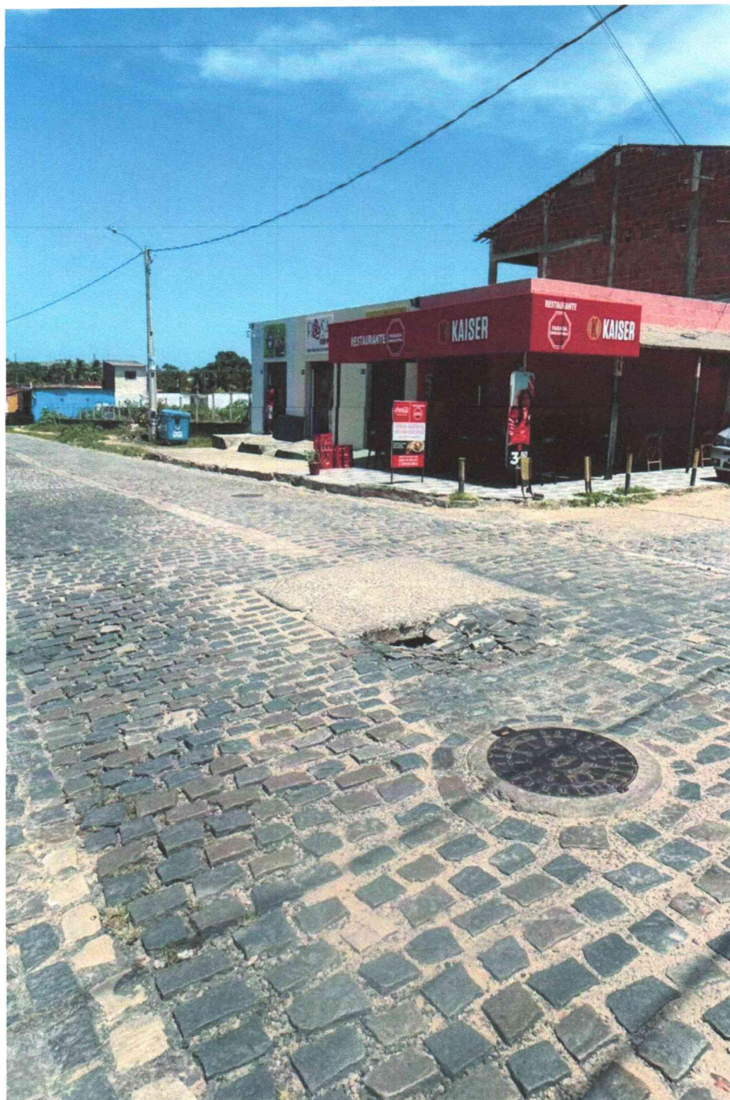
Anexo à indicação nº/2026. Registro fotográfico da demanda requerida realizado no dia 26/02/2026.