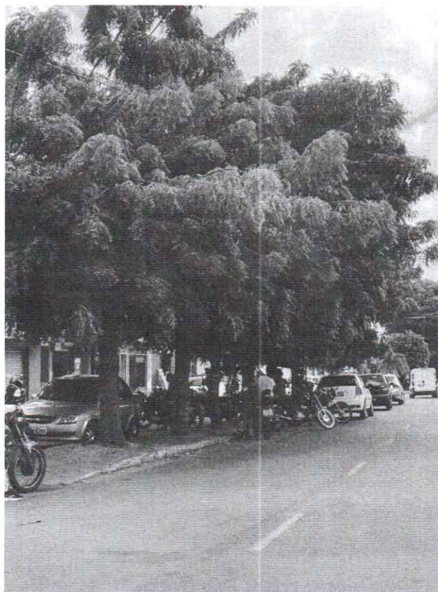
Figura 1: Rua Cruzeiro do Sul / Santos Reis