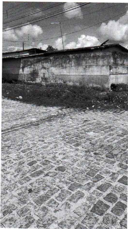
Figuras 1 e 2: Ruas: Capitão Bastos e Ailton Guimarães – Santos Reis