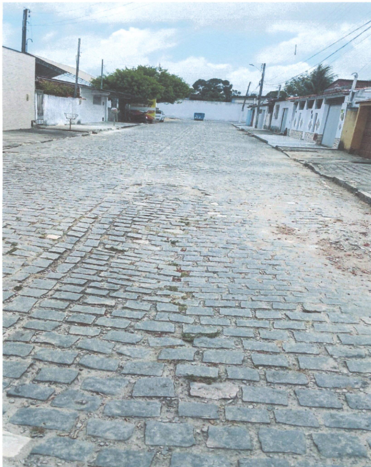
Anexo à indicação nº2.237/2025. Registro fotográfico da demanda requerida realizado no dia 24/11/2025.