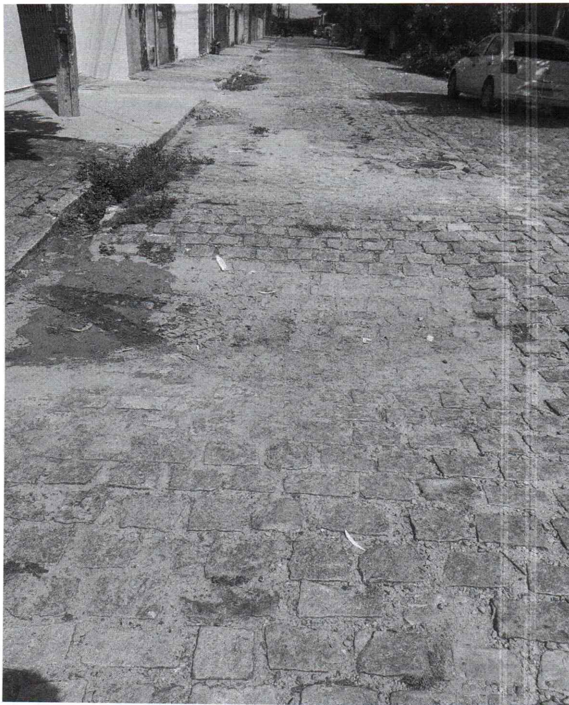
Anexo à indicação nº271/2025. Registro fotográfico da demanda requerida realizado no dia 24/02/2025.