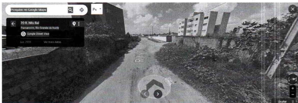
Rua Nilo Bai, Bairro Vale do Sol.