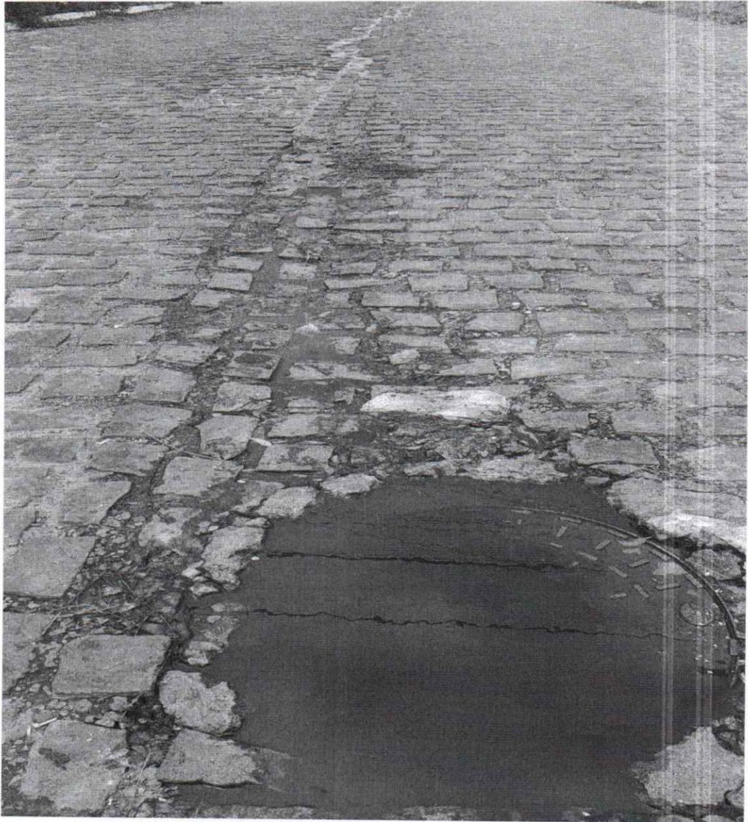
Anexo à indicação nº212/2025. Registro fotográfico da demanda requerida realizado no dia 19/02/2025.