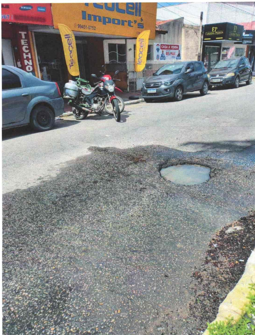
Anexo à indicação nº/2025. Registro fotográfico da demanda requerida realizado no dia 26/05/2025.