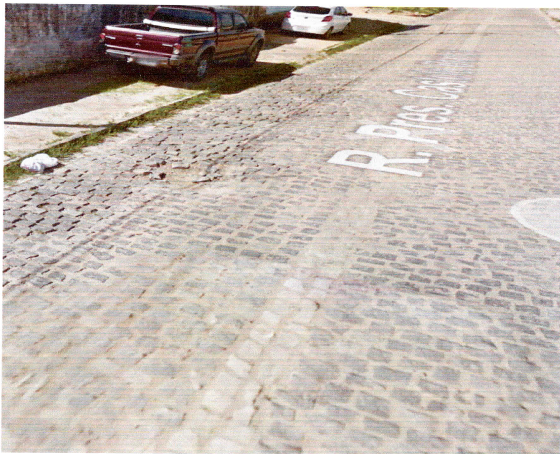
Final da Rua Presidente Castelo Branco.

CÂMARA MUNICIPAL DE PARNAMIRIM A CASA DO POVO